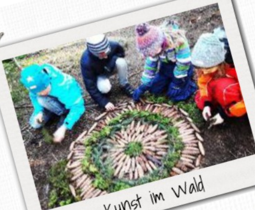
Kunst im Wald