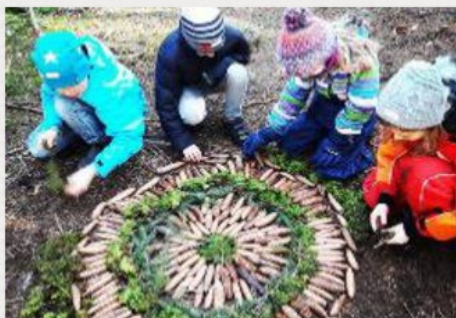
Kunst im Wald