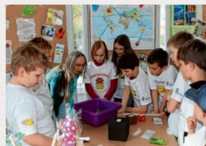
Klimaforscher in Aktion