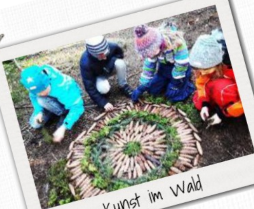
Kunst im Wald