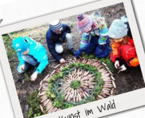
Kunst im Wald