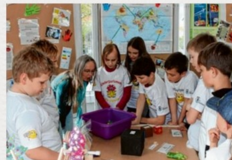
Klimaforscher in Aktion