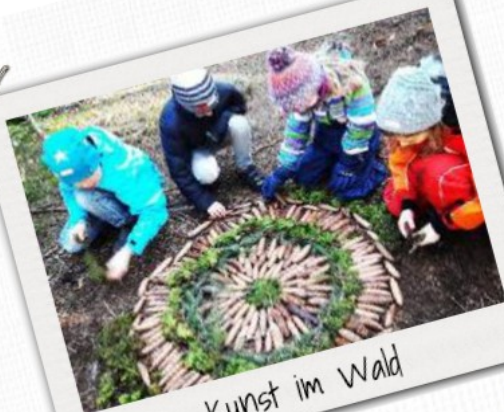
Kunst im Wald