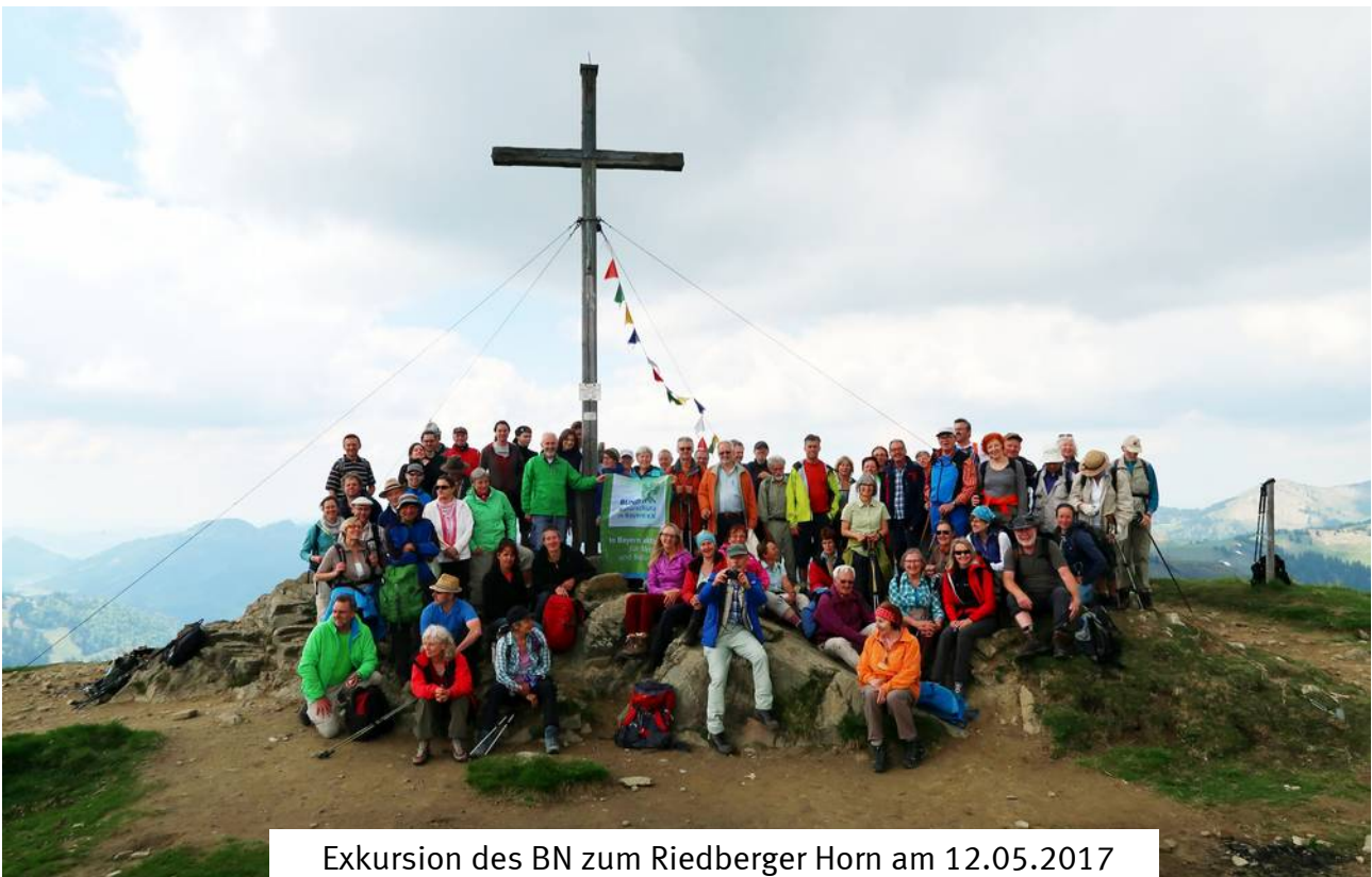
Exkursion des BN zum Riedberger Horn am 12.05.2017